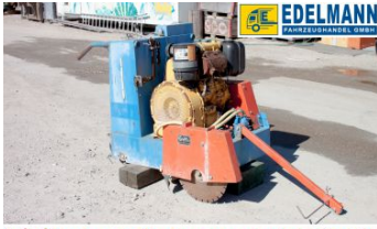
Visit us under www.e-truck.ch