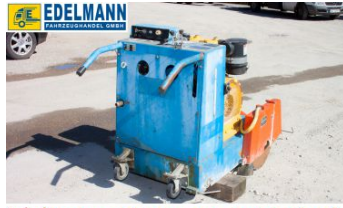
Visit us under www.e-truck.ch