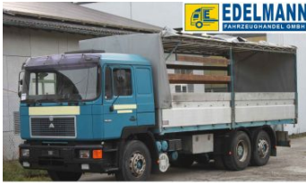
Visit us under www.e-truck.ch