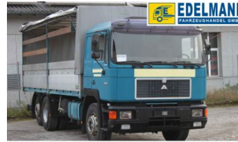
Visit us under www.e-truck.ch