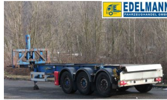
Visit us under www.e-truck.ch