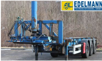
Visit us under www.e-truck.ch