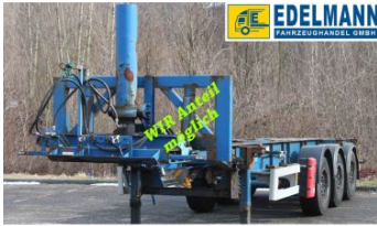
Visit us under www.e-truck.ch