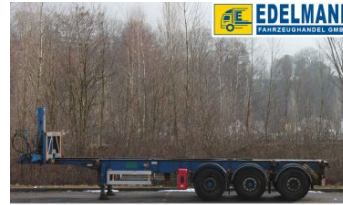
Visit us under www.e-truck.ch