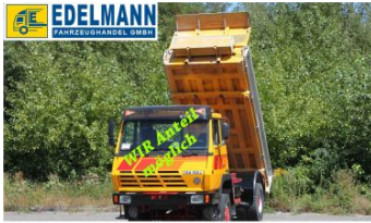
Visit us under www.e-truck.ch